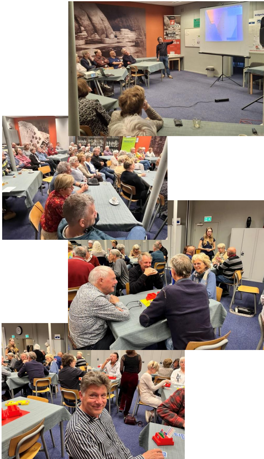
van de middag