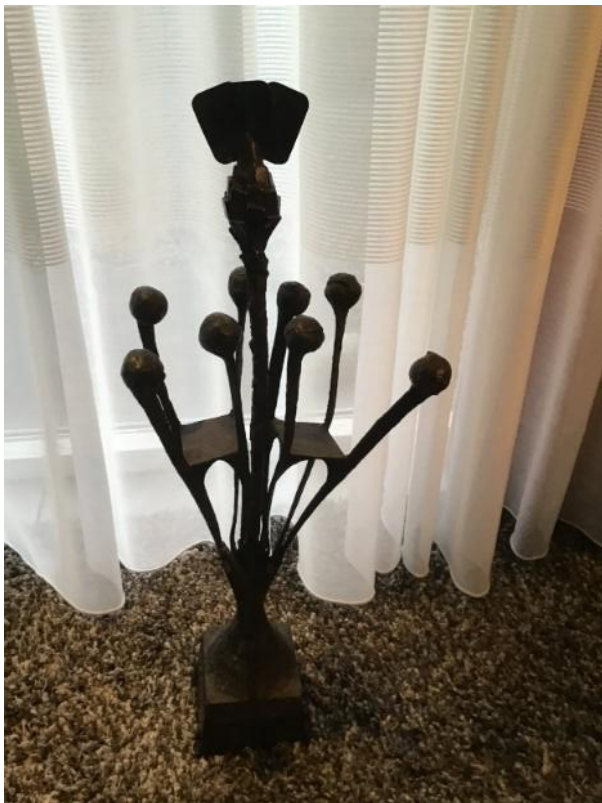
De Adri de Waard trofee

Dit jaar is de Adri de Waardtrofee op zaterdag 15 juni in de Denktank. Het is eigenlijk een clubtoernooi voor clubs uit het district Midden en Oost Gelderland. Bedoeling is dat iedere club drie van zijn sterkste teams afvaardigt. BCH doet al een paar jaar niet meer mee omdat het niet lukt om drie paren bij elkaar te krijgen. Maar dit keer willen we het echt proberen. Wie durft! Inschrijven via bestuur van BCH. Inschrijven kan tot 7 juni. De inschrijvingskosten zijn voor BCH. Meer informatie over inschrijving en regels zijn op is te halen bij het bestuur.