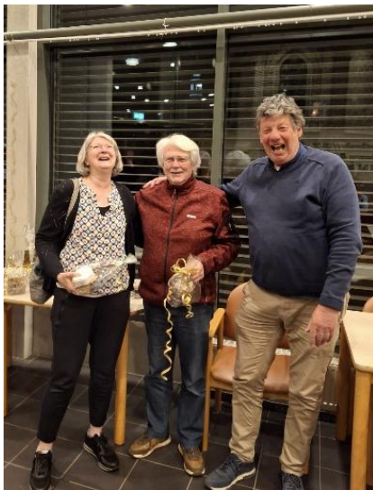
De prijsuitreiking